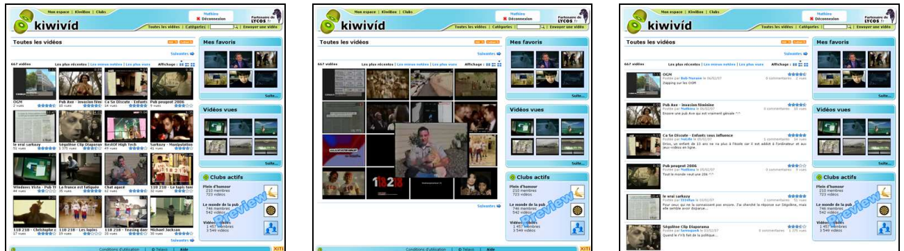
Trois modes de navigation : vignettes / KiwiZap / détaillé

D'un point de vue technologique, le web a énormément à apporter à la vidéo et permet une approche de l'information hors de portée des postes de télévisions. Nous proposons ainsi un mode de navigation qui sert la richesse de la vidéo : la KiwiZap donne accès à tout le dynamisme des couleurs, du son et de l'animation.