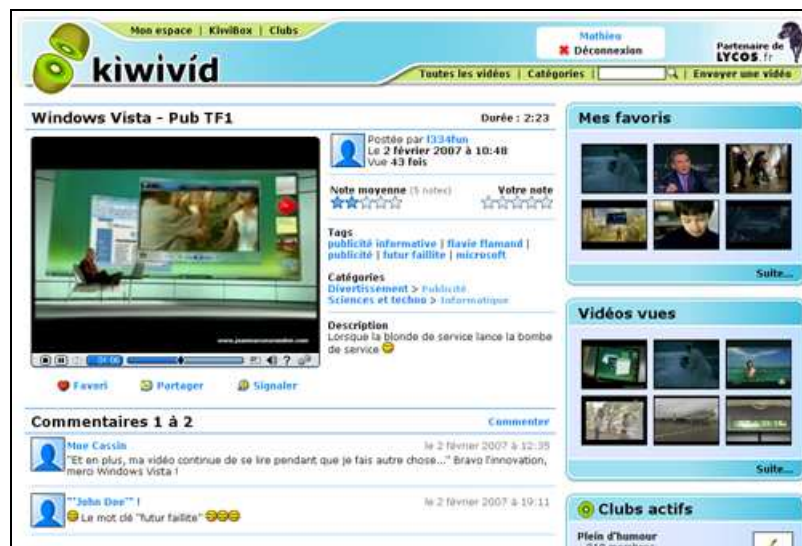
Visualisation d'une vidéo

Les différents éléments du site sont tels qu'ils offrent au visiteur une expérience de navigation de niveau au moins équivalent à ses habitudes quotidiennes. La navigation parmi les vidéos se décline en différents modes, adaptés selon son humeur ou ses objectifs de recherche (en aperçu vignette, en description détaillée ou bien en KiwiZap ). Face aux vidéos, l'utilisateur profite du même confort de visualisation qu'avec un lecteur multimédia de bureau usuel. Le KiwiPlayer permet par exemple de passer en mode plein écran sans rechargement du flux vidéo déjà visionné, ou bien d'utiliser les raccourcis clavier de pause et de silence conventionnels.